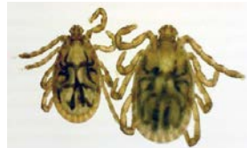
キチマダニの成虫オス♂メス♀

森林や草地などの屋外に生息する比較的大型なマダニです。吸血前は体長3ミリから8ミリですが、吸血後は10ミリから20ミリの大きさになります。