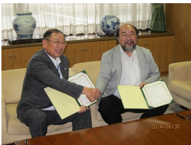
連携の協定書が整いました。