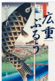
『広重ぶるう』 梶 よう子 新潮社 刊

小6の娘がイジメを苦しに飛び降り自殺を図った。加害者への復讐を誓う母親。中学教師の父親を責める息子。崩壊する家庭を守るため、父親は学校と闘うことを決意する…。『小説野性時代』連載を書籍化。