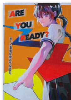
松山南高校2年 井上 優月