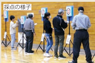
採点の様子 総合計画 目標5 「文化・スポーツ活動により感性が育まれるまちを実現します」

2年ぶりの開催で、屋外では綱引き、ペタンク、グラウンドゴルフが、屋内ではスポーツウエルネス吹矢が行われ、約360人が参加しました。参加者募集の時期が新型コロナウイルス感染症の拡大時期と重なっていたこともあり、少ない参加者とはなりましたが、皆さんたいへん楽しまれていました。写真のスポーツウエルネス吹矢は、子どもや障がいがある人、身長の高い人など、いろいろな人が的までの距離や高さを変えながら一緒に競技しています。秋の気候のいい時期に、体を動かしてみませんか？