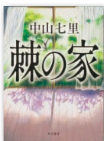
『棘の家』 中山 七里 KADOKAWA 刊

小6の娘がイジメを苦しに飛び降り自殺を図った。加害者への復讐を誓う母親。中学教師の父親を責める息子。崩壊する家庭を守るため、父親は学校と闘うことを決意する…。『小説野性時代』連載を書籍化。