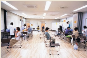
総合計画 目標1 「だれもが地域で幸せに暮らすことができるまちを実現します」

今月の表紙は、「集団検診」の様子です。 町では、受診率の向上を図るため、いろいろな取り組みをしています。各種無料クーポンの配布や、令和3年度から検診の予約がスマートフォンでできるようになったことなどがその1つです。 検診は混雑しているイメージもありますが、5年ほど前から予約制を導入しているため待ち時間も少なく快適に受診できるようになっています。 早期発見、重症化予防のためにも、定期的に検診を受けましょう。