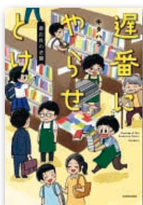
『遅番にやらせとけ』 キタハラ KADOKAWA 刊

書店の中でも一番さえないのは遅番だ。彼らは出版社営業と話すことも棚をいじることもない。もくもくとレジ打ちしカバーをかけ、返品作業をこなし、掃除をする。そんな彼らでもさまざまな事情を抱えていて。