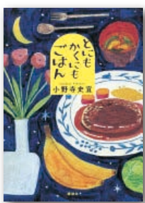
『とにもかくにもごはん』 小野寺 史宜 講談社 刊

書店の中でも一番さえないのは遅番だ。彼らは出版社営業と話すことも棚をいじることもない。もくもくとレジ打ちしカバーをかけ、返品作業をこなし、掃除をする。そんな彼らでもさまざまな事情を抱えていて。