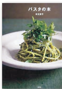
『パスタの本』 有元 葉子 東京書籍 刊

小説家の夫と妻を巡る、長いつきあいの友人たちやまわりの人々、日々の暮らしの中でふと抱く静かで深い感情、失って気付く愛着、交錯する記憶…。かけがえのない時間を描いた長編小説。