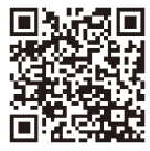
▲愛媛地方税 滞納整理機構 HP