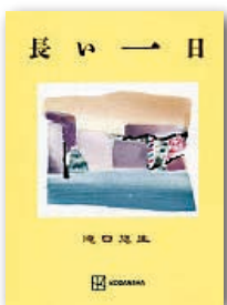
『長い一日』 滝口 悠生 講談社 刊

3年前のストーカー殺人事件で、人生を狂わされた元市役所職員・佑美のもとに、星谷と名乗る謎の男が現れる。彼による事件の「再検証」が、壮大な悲劇の連鎖を明らかにし…。書き下ろしクライム・ミステリー。