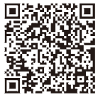
▲国税庁 公売情報 HP