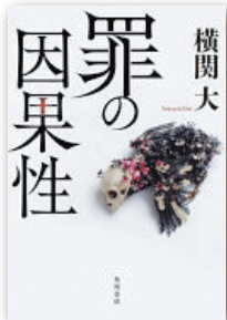
『罪の因果性』 横関 大 KADOKAWA 刊

3年前のストーカー殺人事件で、人生を狂わされた元市役所職員・佑美のもとに、星谷と名乗る謎の男が現れる。彼による事件の「再検証」が、壮大な悲劇の連鎖を明らかにし…。書き下ろしクライム・ミステリー。