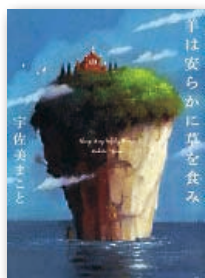
『羊は安らかに草を食み』 宇佐美まこと 祥伝社 刊

母親離れができない優柔不断な夫に見切りを付け、家を出た美佐は、東京の下町・谷中で着物のネットショップを切り盛りしている。ある日、実家の蔵で、筆筒に仕舞われた銘仙、謎の写真、3冊のノートを見つけ…。