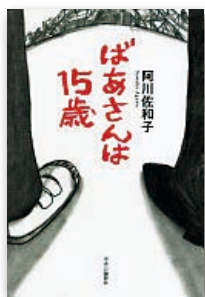
『ばあさんは15歳』 阿川佐和子 中央公論新社 刊