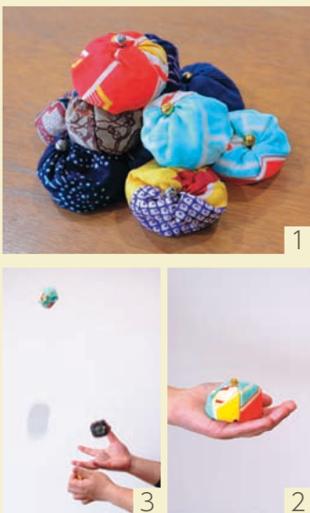
砥部むかしのくらし館所蔵のお手玉

母から娘、孫へと伝わる女の子の遊びとして親しまれましたが、核家族が進むとともに伝承が難しくなりました。