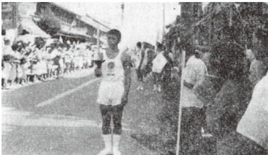
1964年10月とべまち（広報紙）より