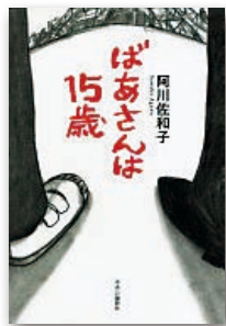
『ばあさんは15歳』 阿川佐和子 中央公論新社 刊