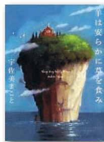
『羊は安らかに草を食み』 宇佐美まこと 祥伝社 刊

母親離れができない優柔不断な夫に見切りを付け、家を出た美佐は、東京の下町・谷中で着物のネットショップを切り盛りしている。ある日、実家の蔵で、筆筒に仕舞われた銘仙、謎の写真、3冊のノートを見つけ…。