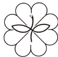
民生委員・児童委員のマーク