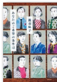
『あなたのご希望の条件は』 瀧羽麻子 祥伝社 刊

警視庁捜査一課に所属する平凡な刑事、和戸宋志。難事件は居合わせた人々が真相を解き明かすが、それは和戸の特殊能力のおかげで…。本格ミステリ短編集。