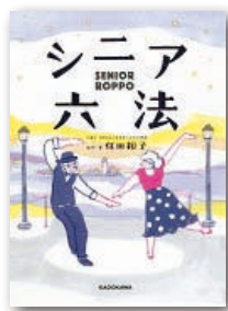
『シニア六法』 住田裕子 KADOKAWA 刊

介護トラブルやオレオレ詐欺にあつた時の正しい対処法、熟年離婚で「まさか!」に陥らないための知識、成年後見制度や相続の大切な基本…。シニア世代に必要な法律の大事なポイントをわかりやすく紹介する。