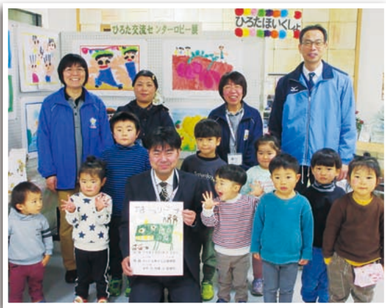
ひろた交流センターの行事に参加している様子

園外に出ることも多く、散歩の道中では、すれ違う人から「かわいいねえ」「どこ行くの?」と声をかけてもらい、会話がはずみます。また、ひろた交流センターや地域ぐるみの行事にも参加します。地域の人たちは、「子どもは宝」と言われるように、大切な存在として見守り、育ててくれています。子どもたちは、地域の人々の優しさや温かさを肌で感じています。 この地域で生まれ、育ち、楽しさをたくさん味わい、誰からも大切にされている経験が、生きていく上での基盤となり、地域に帰ってくる原動力となります。 子どもたちの「生まれ育った場所を大切に思う気持ち」を育みながら、これからも地域の人々とたくさん触れ合っていきたいと思っています。