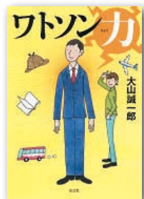
『ワトソンカ』 大山誠一郎 光文社 刊

介護トラブルやオレオレ詐欺にあつた時の正しい対処法、熟年離婚で「まさか!」に陥らないための知識、成年後見制度や相続の大切な基本…。シニア世代に必要な法律の大事なポイントをわかりやすく紹介する。