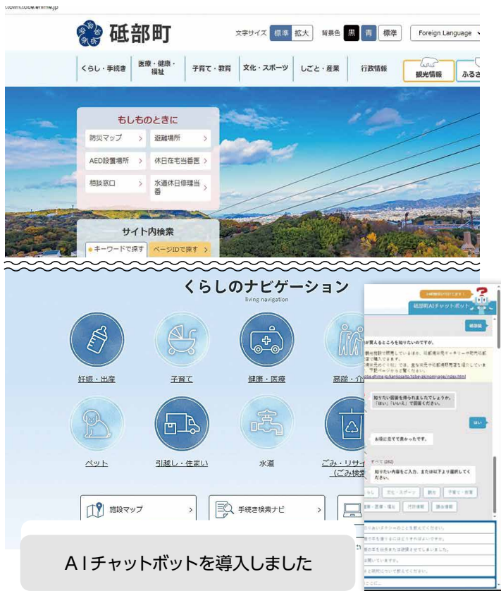
AIチャットボットを導入しました