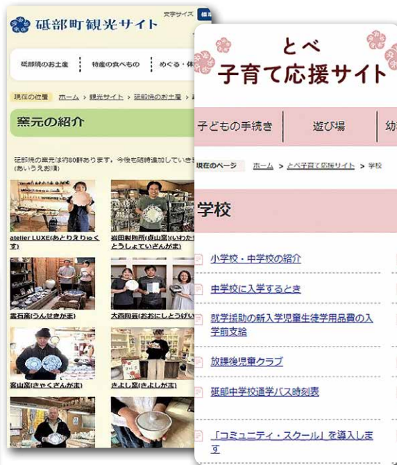
観光や子育ての専用サイトをつくりました。これからもっと情報を増やしていきます。