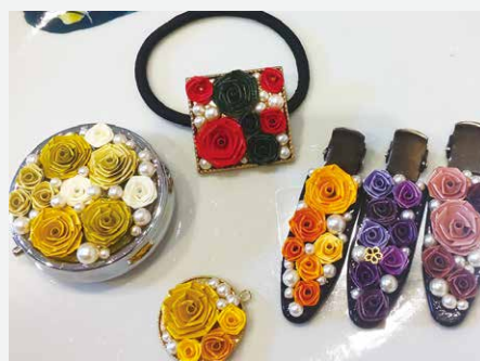
ロザフィで作成したアクセサリー

初めての手織り、居合道、太極拳、ロザフィ～紙で作るバラのアクセサリーなど、全16講座の受講生を随時募集しています。