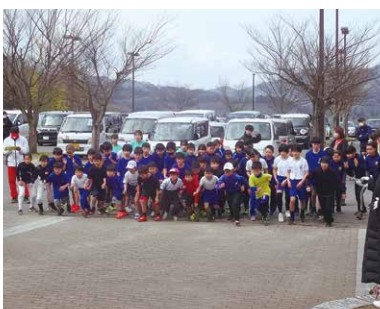
マラソンの部スタート