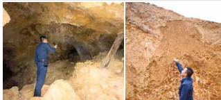
以前の坑道 今は露天掘り