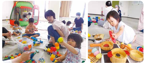
JA えひめ中央城南会館での様子

日 3月12日(日) 10時～11時30分 場 砥部児童館 対 乳幼児とその保護者 問 とべファミリー・サポート・センター ☎(962)1988