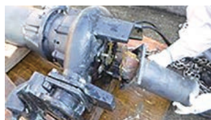
レンガが詰まったポンプ

原因は、公共下水道に接続している建物を解体する際に、公共ますにキャップ止めを行わなかったことだと考えられます。