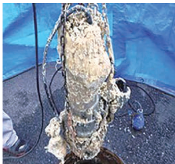
油がこびりついたポンプ

台所の流しに油を流すと下水道管の内側で固まって詰まりを引き起こします。下水道管が詰まると、悪臭が発生するだけでなく汚水が逆流して排水口からあふれ出ることもあります。