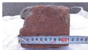
ポンプから出てきたレンガ

公共下水道および農業集落排水の処理区域内では、個人の敷地内に公共ますが設置されています。