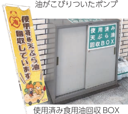
使用済み食用油回収BOX

浄化センターへ布状のものが流れ着いた事案も発生しています。布やタオル、紙おむつなどをトイレに流すのも、絶対にやめてください。