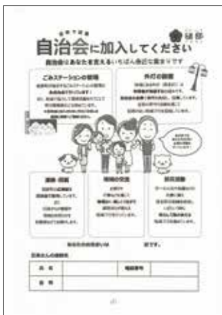
(自治会加入 案内チラシ)

自治会や参加する 人の考え方、ルール は千差万別で、大き な問題になっていな いところもある。