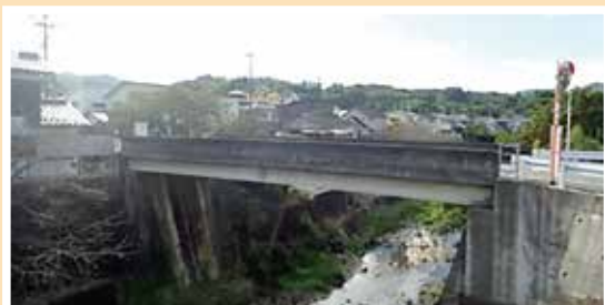
(富士団地前富士橋)