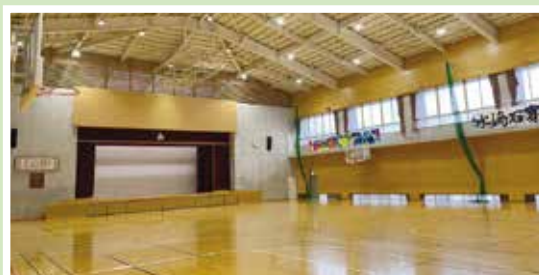
(砥部中学校体育館)