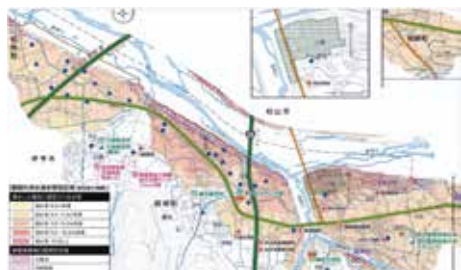
防災マップ(麻生地区)

戸別受信機の在庫活用と浸水想定区域への設置推進に関し、近年、新興住宅地を中心に普及している高气密・高断熱の住宅では、屋外スピーカー、防災行政無線の放送が聞き取りにくいという声や、町にも寄せられている。特に豪雨時には、雨音そのものが騒音となり、屋外放送だけに頼ることには限界がある。