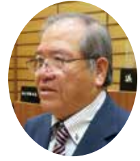
ひのけいじ 議員 日野 恵司