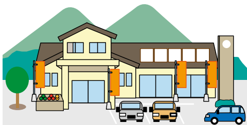
(道の駅のイメージ)

町内には大規模開発が可能な公有地や平地が不足している。仮にそのような適地が確保できた場合、「道の駅」という選択肢に加え、企業誘致など、どのような事業が町の未来に資するかを総合的に判断する。