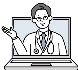
(オンライン診療 イメージ)

オンライン診療や新たな送迎体制に慣れていただける期間を設けるよう、前向きに考えていく。