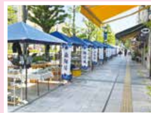
(花園砥部焼まつりの様子)