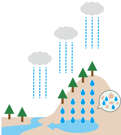
(水源涵養林のイメージ)

※水源涵養林とは 雨水を土壌に貯えてゆっくりと川へ流し、安定した水資源を確保する、緑のダム」の役割を持つ森林