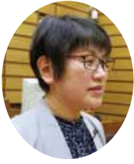
たかはし くみ 議員 高橋 久美