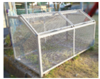
ごみステーションの一例