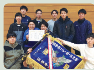
南伊予体育会 (砥部町)