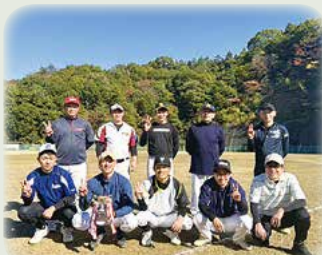
二部優勝 南ヶ丘・南ヶ丘北