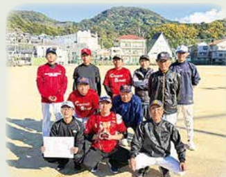
三部優勝 中通・上ノ山