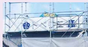
施設名の看板を設置

でもご使用いただけます。 3月15日の完成に向け、工事 もいよいよ佳境を迎えています。 近隣住民の皆様には今しばらく ご迷惑をおかけいたします。