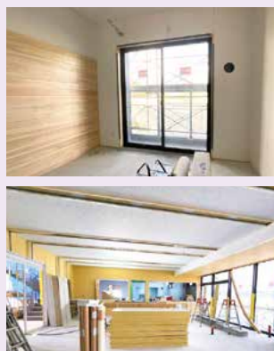
工事中の居室(上)と食堂

教育寮トベリエが拠点となり、 学生と地域住民の交流が広がり、 地域の活性化と共に砥部分校の さらなる発展につながる活動が できればと考えています。