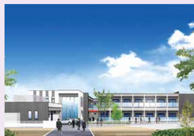
砥部町教育寮トベリエ完成予想図 とべぶんのデザイン科生が集まる場所 「砥部のアトリエ」から「トベリエ」と いう名称になりました。

県立松山南高等学校砥部分校 の学生で、県外や県内の通学が困 難な生徒を受け入れるため、令和 7年4月の運用開始に向けて、教 育寮トベリエを建設しています。 建設地は五本松の県窯業試験 場跡地です。砥部分校からは徒歩 10分の場所にあります。定員は各 学年15名の45名で、構造は鉄骨造 2階建、宿舍棟と共用棟となります。 居室は、約45畳の個室1Kで ベッド、机、椅子、エアコン、 簡易キッチン、ユニットバス、 トイレ、洗面化粧台等の生活に 必要な設備は備えています。 共用棟には食堂と多目的ホール があり、寮生の食事スペース以外に も寮生同士の交流や、寮生以外の