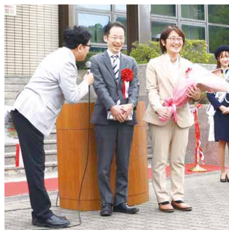
記念品贈呈の様子 （第39回砥部焼まつり）