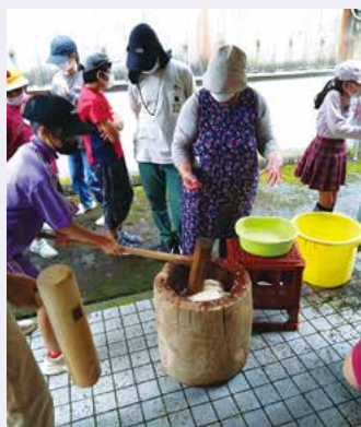
山村留学生と餅つきをしました！

かなり早い段階で上司に「こんな企画があります！」と大演説したのも今では恥ずかしい思い出ですが、真摯に聴いてくださったことには感謝しています。よく考えればわかるのですが、他所から来た人がいきなり「この地域を良くします！」なんて言っても元からいる住民からすれば「何も知らないのに何言っているの？」ってことになりますよね。その辺を当初の僕は理解できておらず、何もさせてもらえないと焦るばかりでした。