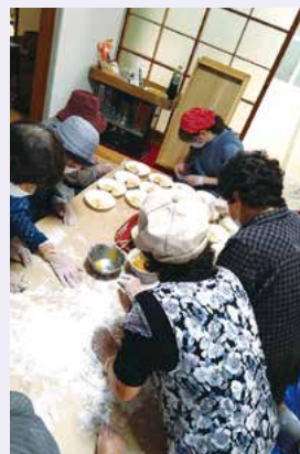
高市おいでやサロンにも参加して交流

あの頃にお会いした方々との繋がりや経験が、その後の活動の指針や基盤となり、それらをきっかけにさらにいろいろな方と関わる機会を得て、自然とお世話になった方々や砥部町に恩返ししたいという考えになりました。そして現在、着任当初と違って地域の現状やニーズを理解したうえで、企画を考案しています。お会いしたきりご無沙汰している方もいるかと思いますが、得体の知れない移住者の僕に砥部町のことを教えてください、感謝の気持ちでいっぱいです。