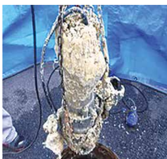
油がこびりついたポンプ

台所の流しに油を流すと下水道管の内側で固まって詰まりを引き起こします。下水道管が詰まると、悪臭が発生するだけでなく汚水が逆流して排水口からあふれ出ることもあります。