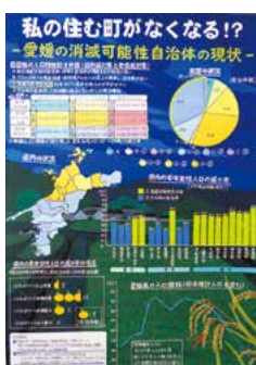
作品名「私の住む町がなくなる!? ～愛媛の消滅可能性自治体の現状～」