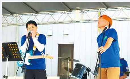
ハーモニカ初演奏

来年度は、地域おこし協力隊の3年目で最終年を迎えます。任期が終われば地元に戻るということは当初から考えておらず、砥部町に永住する気持ちで来たので、退任後の仕事や生業についても念頭に置きながら活動を行ってきました。その一環として、関係人口の増加や人口減少問題の探究のため「えひめ結婚支援センター」でボランティア活動を始めました。地域おこし協力隊に加え、婚活イベントに携わることで今後に役立つと考えたからです。