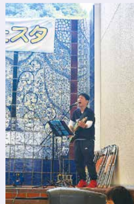
福祉フェスタで熱唱

さて、この原稿を書いている現在はまだ11月でして、この秋はイベント目白押しでした。地方祭に始まり、砥部町福祉フェスタ、広田ふるさとフェスタ、芸術文化フェスタとすべての催しに自慢のギターを登場させました。中でも砥部町福祉フェスタの中庭ステージでは司会進行を仰せつかり、広田ふるさとフェスタの「ひろたバンド」ではハーモニカを演奏するなど新しい試みにも挑戦させていただきました。今回はバンドメンバーの都合が合わず、直前の練習日によりやく全員が揃うという状況でしたが、無事演奏できました。次回は3月9日（日）の広田芸能発表会に出演予定ですので、ぜひお越しください！