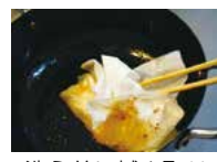
洗う前に拭き取り