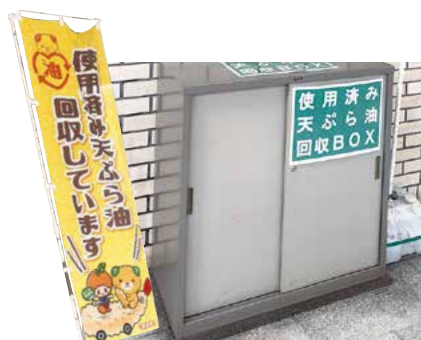
使用済み天ぷら油回収BOX

中央公民館、ひろた交流センター、DCM 砥部店、DCM 宮内店でも実施しています。