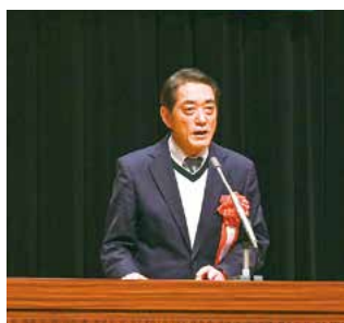
来賓 中村 時広知事