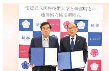
連携協力協定調印式