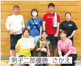
男子二部優勝 さかえ