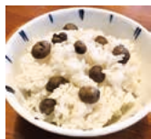
むかごを米と一緒に炊き込んだ「むかごご飯」