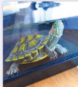
マンション駐車場で出会ったミドリガメ。砥部川からやってきた？

僕の住まいは川べりのマンションですが、先日、駐車場でミドリガメを保護してしまいました！「してしまった」という表現になるのは、ミドリガメ（ミシシippアカミミガメ）の規制が始まったというニュースを見た記憶があったからです。調べてみたところ「条件付特定外来生物」といい、アカミミガメやアメリカザリガニは、これまで通りペットとして飼育できますが、野外に放すことは禁止されているとのこと。