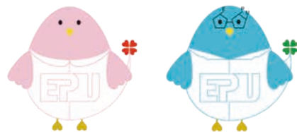
マスコットキャラクター トッピーとイッピー