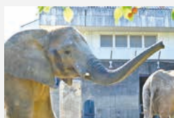
アフリカゾウの「媛」

国内で初めて人工哺育で育ったアフリカゾウの「媛」が11月9日に18歳を迎えます！お祝いとして、特製フルーツもプレゼント予定です♪