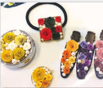
ロザフィ～紙で作る バラのアクセサリー

ロザフィ～紙で作るバラのアクセサリー、健康居合道、オカリナ講座、初めての手織り、バレエストレッチ等、全 20 講座の受講生を随時募集しています。