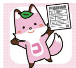
戸籍制度イメージキャラクター 「コセキツネ」